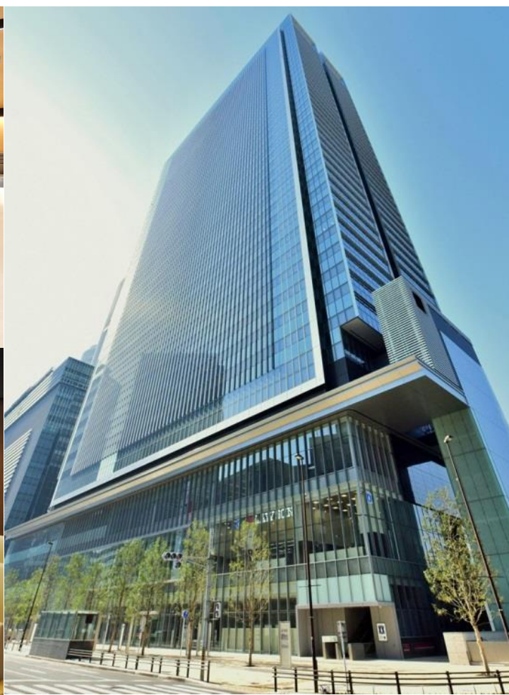
左上：受付、左下：女性用待合、右：JPタワー名古屋