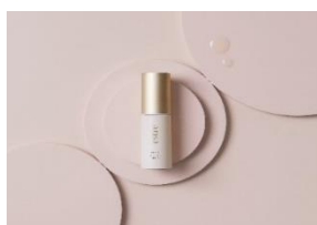
デリケートリッチ オイルセラム