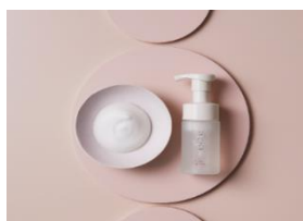
デリケートソフト ウォッシュ