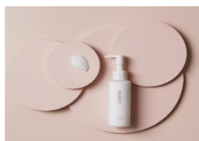
デリケートソフト ジェルクリーム