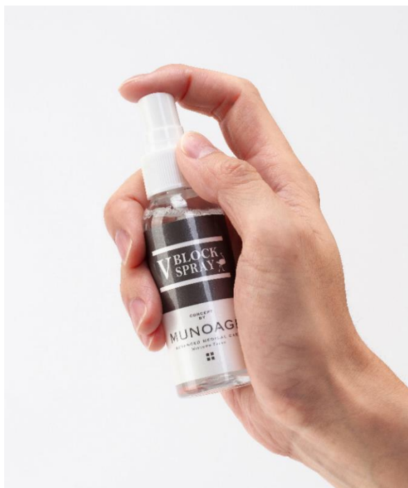
ミュノアージュ V BLOCK スプレー

リゾートトラスト株式会社(以下、リゾートトラスト)のグループ企業である株式会社アドバンスト・メディカル・ケア(東京都港区、代表取締役社長:古川哲也)は、スキンケアブランド「MUNOAGE(ミュノアージュ)」から、ダチョウ卵黄エキス ※1 を配合した化粧水「ミュノアージュ V BLOCK スプレー」を12月10日(木)に発売します。