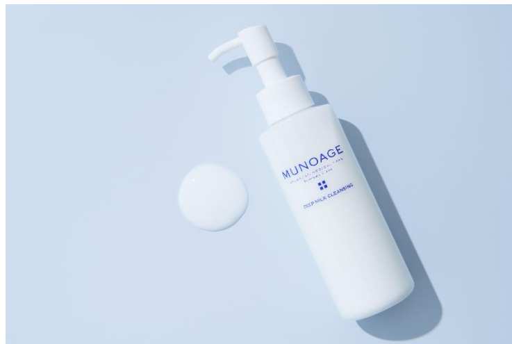
MUNOAGE(ミュノアージュ)ディーブミルククレンジング

リゾートトラスト株式会社(以下、リゾートトラスト)のグループ企業である株式会社アドバンスト・メディカル・ケア(東京都港区、代表取締役社長:古川哲也)は、皮膚科学目線から生まれたエイジングケア ※1 ブランドMUNOAGE(ミュノアージュ)の「ディーブミルククレンジング」をリニューアルし、9月9日(金)に販売を開始します。